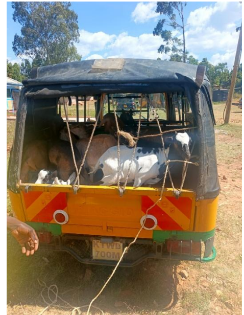
Dann kurz vor der Verteilung der Gewinne traf der erste von vielen Transportern mit den Ziegen ein.