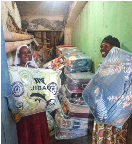
GANZE Lagerräume wurden leergekauft

Gleich nach der Tombola sollte es an die Besorgung der Gewinne gehen. Doch dazu musste erst der nötige Betrag auf dem Konto der Kooperative eingegangen sein. Täglich fragten die Witwen nach und warteten auf den Zahlungseingang, aber die Bank brauchte in diesem Jahr lange, bis der Betrag gebucht war.