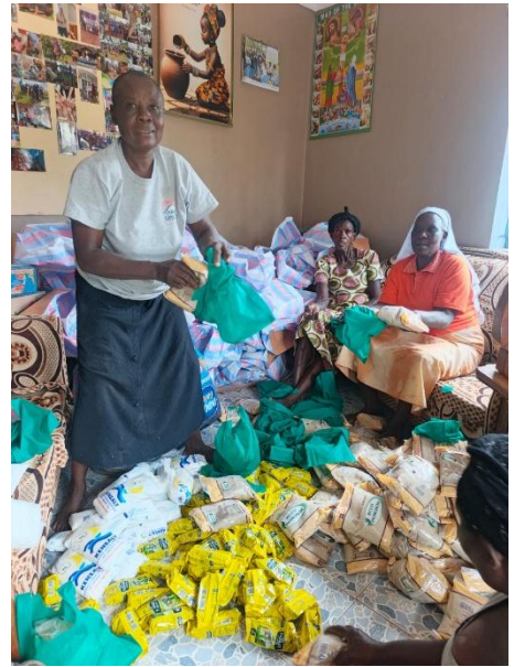
Gepackt wurde mit großer Vorfreude und viel Spaß.