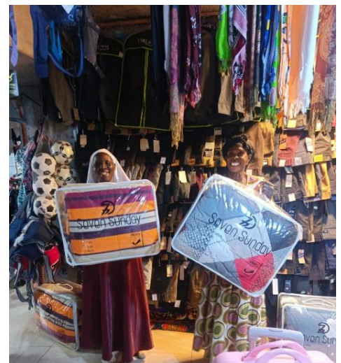
Bettdecken für Geborgenheit, Wärme,

Felder können bestellt werden, die Ernte wird verkauft und Schulgebühren können davon bezahlt werden.